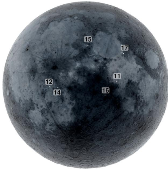
D'après NASA Scientific Visualization studio

Chaque mission a rapporté sur Terre des échantillons de roches lunaires.